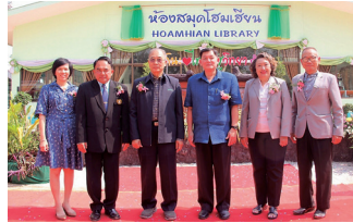
โรงเรียนไทยรัฐวิทยา 51 (บ้านโคกกวาง) จังหวัดบึงกาฬ