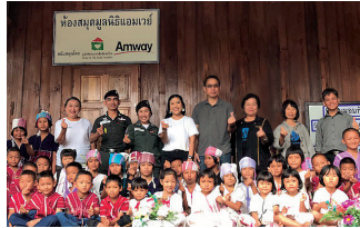
โรงเรียนตำรวจตระเวนชายแดนบ้านแม่ลาจิว จังหวัดแม่ฮ่องสอน