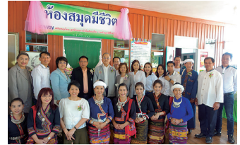
โรงเรียนไทยรัฐวิทยา 98 (บ้านงอบ) จังหวัดน่าน