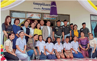
โรงเรียนตำรวจตระเวนชายแดนช่างกลปทุมวันอนุสรณ์ 8 จังหวัดนครพนม

มูลนิธิแอมเวย์เพื่อสังคมไทยเปิดโอกาสทางการศึกษาให้เด็กไทยได้เข้าถึงแหล่งเรียนรู้ที่ได้มาตรฐาน ด้วยการสร้างและพัฒนาห้องสมุดมูลนิธิแอมเวย์ ให้แก่นักเรียน 562 คน ใน 4 โรงเรียนพื้นที่ห่างไกล