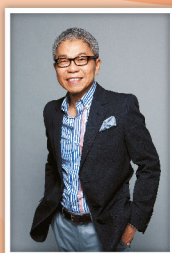
ผู้สนับสนุนมูลนิธิฯ จำนวน 4,000,000 บาท

ขอขอบพระคุณผู้ร่วมบริจาคเงินสนับสนุนกิจกรรมมูลนิธิฯ และผู้บริจาคต่อเนื่อง 5 ปี