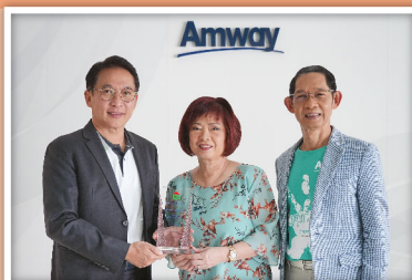
ผู้สนับสนุนมูลนิธิฯ ประจำปี 2565 ยอดเงินบริจาค 100,000 - 199,999 บาท