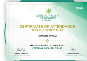
ภาพตัวอย่าง

ประกาศนียบัตรจาก บริษัทแอมเวย์ เมื่อผ่านตามข้อกำหนดของหลักสูตร